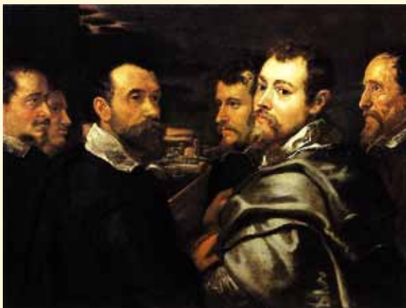
Pieter Paul Rubens - Autoritratto con amici a Mantova, 1602-1604. Olio su tela